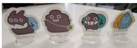
大口塵 肥塵 塵 眼淚