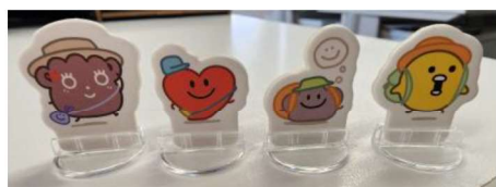
塵薇 內心 微塵 太陽雞